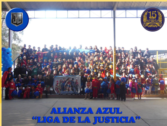
ALIANZA AZUL "LIGA DE LA JUSTICIA"