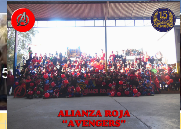
ALIANZA ROJA "AVENGERS"