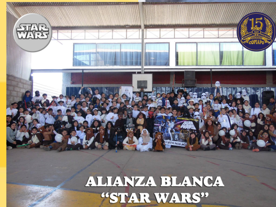
ALIANZA BLANCA "STAR WARS"