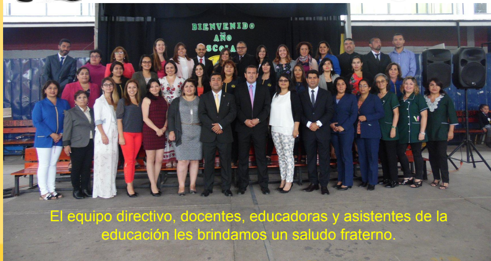
El equipo directivo, docentes, educadoras y asistentes de la educación les brindamos un saludo fraterno.

Esta presentación se puede descargar desde www.colegiosanagustindeatacama.cl