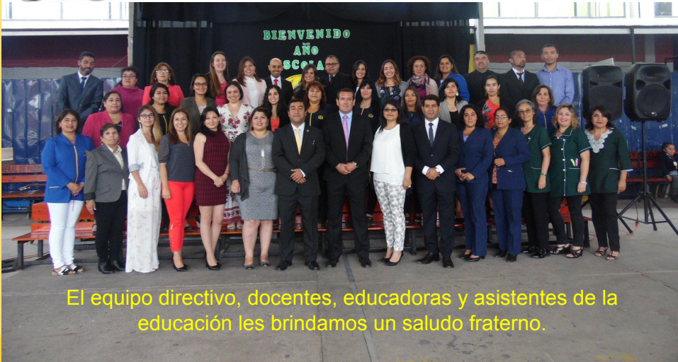
El equipo directivo, docentes, educadoras y asistentes de la educación les brindamos un saludo fraterno.