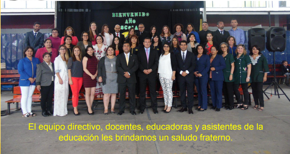
El equipo directivo, docentes, educadoras y asistentes de la educación les brindamos un saludo fraterno.